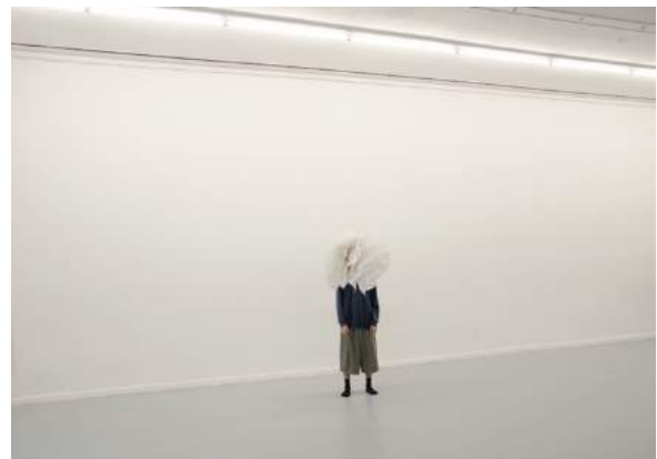
Minh Duc Pham

»One day I can let myself cry«, 2020