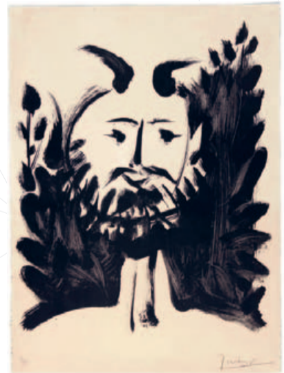
Pablo Picasso, Foine Souriant , 1948