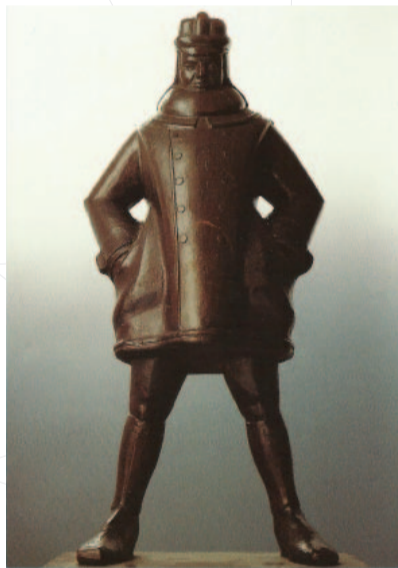
Rudolf Belling, Der Flieger , 1916