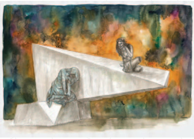
Alex Tennigkeit, Girls with Architecture , 2013