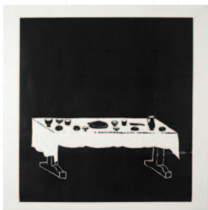
Andrea Büttner, Tisch , 2010