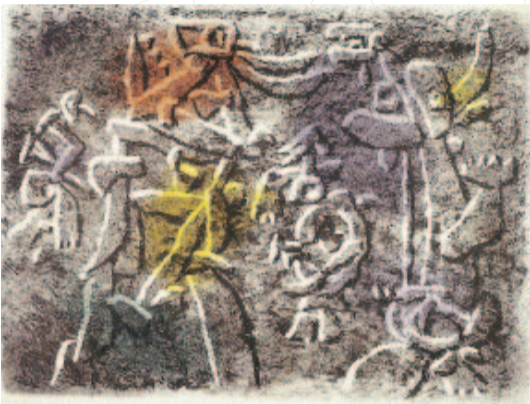
Willi Baumeister, Magie Rupestre , 1953