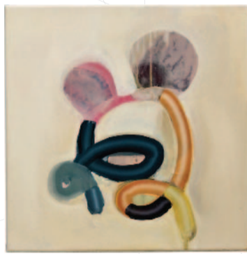
Jens Braun, Schnörkel 08 , 2010