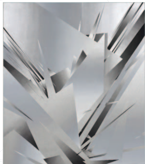
Stephan Jung, Polygone TANK 1 , 2002