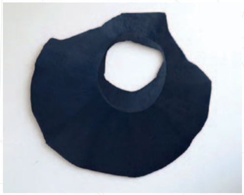
Armin Hartenstein, TONDO II (Blauschwarz) , 2011